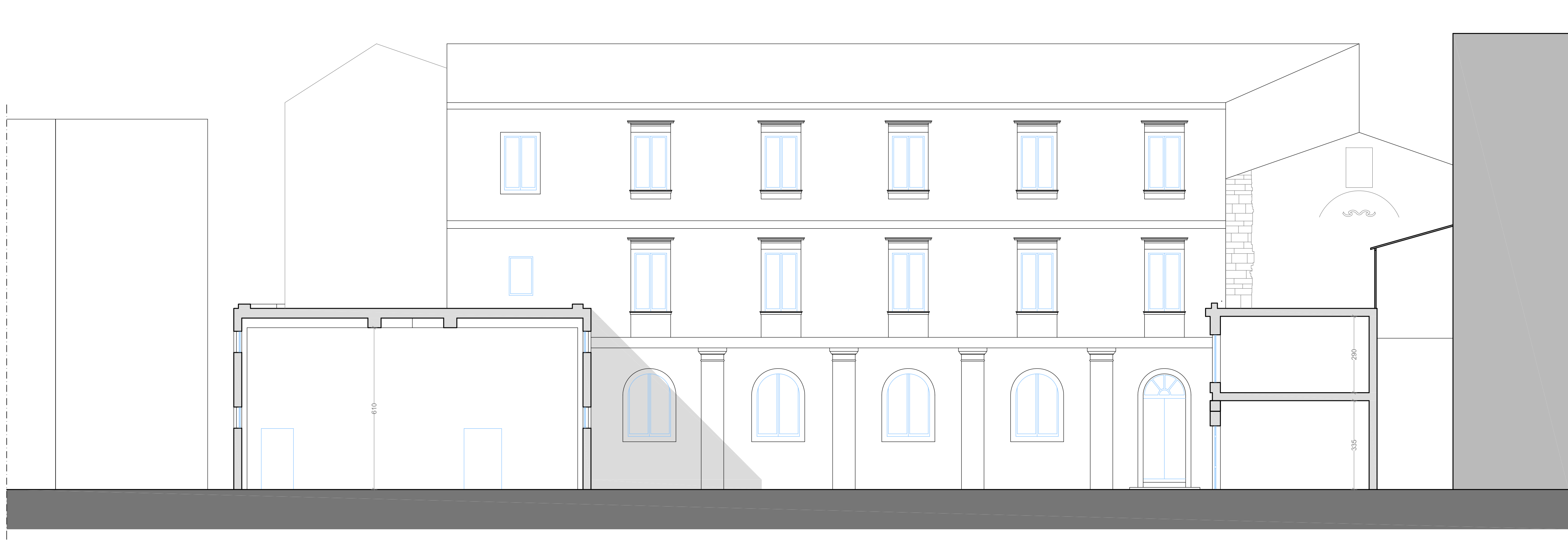
STATO DI FATTO SEZIONE C-C 1:100