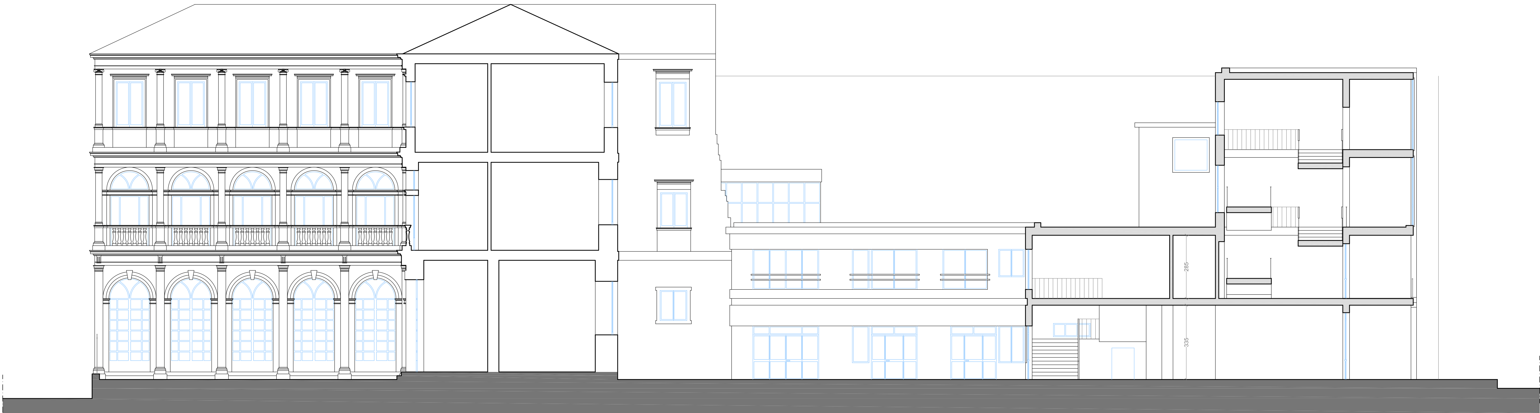
STATO DI FATTO SEZIONE G-G 1:100

Gaetano Manganello Carmelo Tumino architetti Internet: www.architrend.it E-mail: studio@architrend.it Via Padre G. Tumino, 23 RAGUSA Tel./Fax: 0932 602691