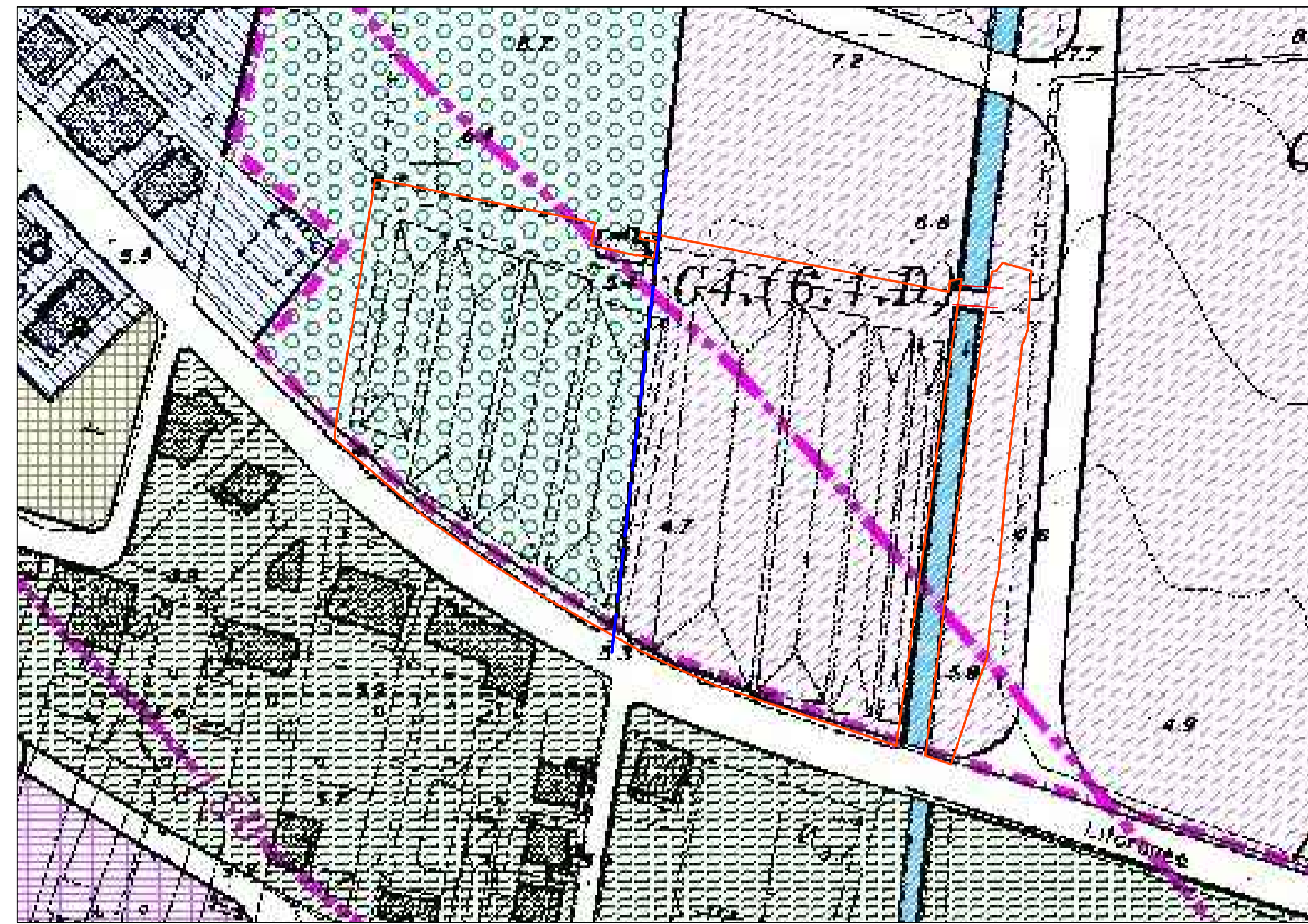
Stralcio P.R.G. scala 1:2000

Via Matrice n. 10 - 97018 Scicli (RG) Tel 0932/932275 - 339/3284144 mail: carmelovanasia@alice.it - PEC: carmelovanasia@geopec.it