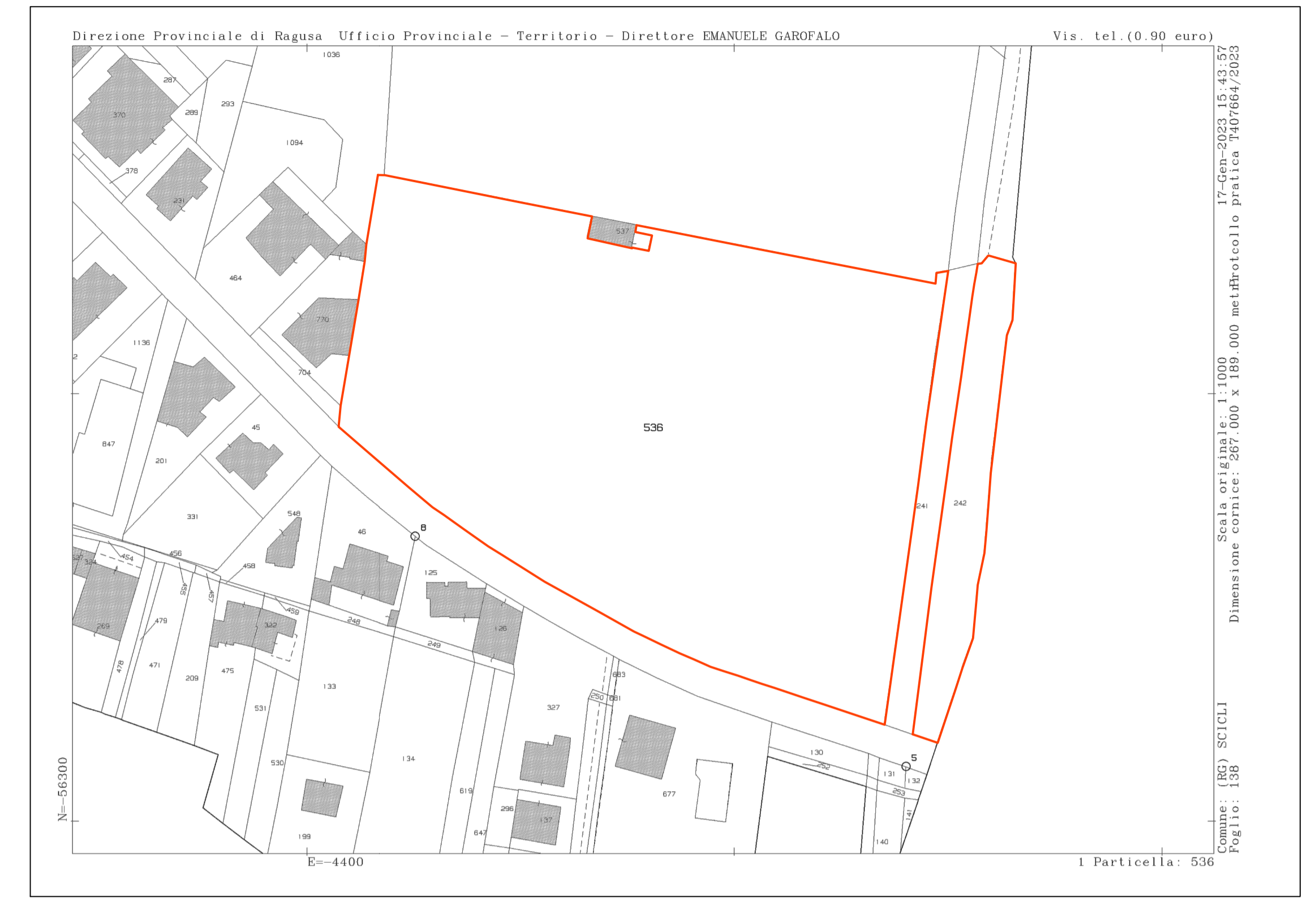
Estratto di Mappa Catastale scala 1:1000 - Fg 138 p.IIe 536 - 242