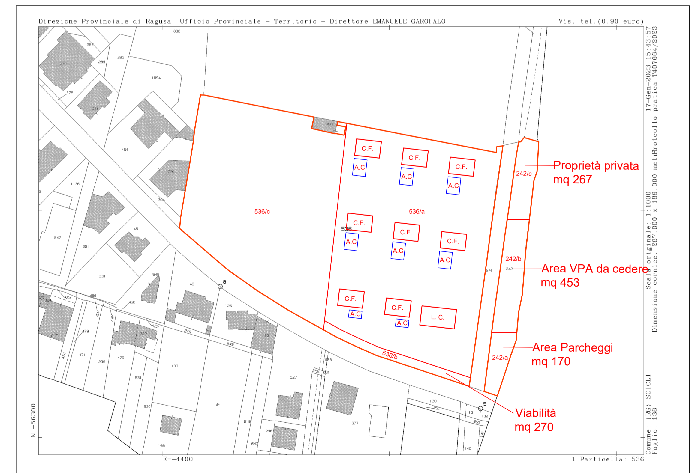
Particolare del lotto con posizionamento dei fabbricati scala 1:1000