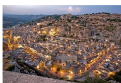
Aria di Storia

Scicli è anche la costa di spiagge e riserve naturali più lunga della zona (18 km), dove le passeggiate per vedere il tramonto sul mare, le aree ciclabili e in particolare le lunghe spiagge libere di sabbia fine, racchiudono in breve il senso profondo della scelta di vita in Sicilia, anche quella di tanti nuovi siciliani che hanno deciso di lasciare le proprie città di origine per venire a vivere in Sicilia.