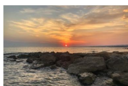
Aria di Natura