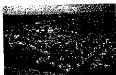
Aria di Storia

SCICLI CENTRO STORICO BAROCCO CON VISTA MARE