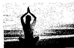
Aria di Leggerezza