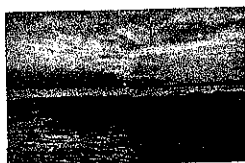
Aria di Natura