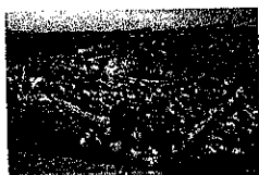
Aria di Storia

Scicli è anche la costa di spiagge e riserve naturali più lunga della zona (18 km), dove le passeggiate per vedere il tramonto sul mare, le aree ciclabili e in particolare le lunghe spiagge libere di sabbia fine, racchiudono in breve il senso profondo della scelta di vita in Sicilia, anche quella di tanti nuovi siciliani che hanno deciso di lasciare le proprie città di origine per venire a vivere in Sicilia.