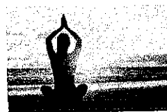
Aria di Leggerezza

PROGETTO Aria è un piano di servizi pensato per l'incremento dei flussi turistici verso Scicli centro storico e la sua fascia costiera, promosso dal Comune di Scicli e elaborato insieme alle associazioni di categoria. Il progetto intende anche siglare un accordo per la collaborazione tra pubblico e privati, per un costante miglioramento delle attività imprenditoriali coinvolte, favorendo l'utilizzo di prodotti agricoli locali, di percorsi naturali e culturali, e complessivamente di una proposta più completa di turismo sostenibile. Un obiettivo che si ritiene essenziale ma che è anche una sfida, per affrontare e superare gli scompensi della recente crisi sanitaria mondiale, una sfida simile ad altre già vinte da questa vivace cittadina.